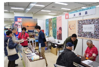
アイランダー出展支援