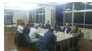
北部ブロック協議会