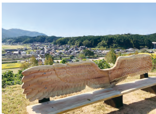
三丘ゆめひろば（三丘地区）