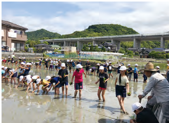
コミュニティ学習田（久米地区）