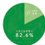
図10 ボランティア活動経験の有無 (周南市市民1,000名)

ボランティアセンターを運営する社会福祉協議会など、関係機関との連携を進めることで周南市におけるボランティアコーディネートをより効果的にを行い、ボランティアへの参加者の増加を促す。