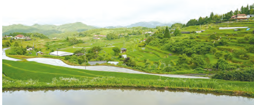
中須北の棚田（中須地区）