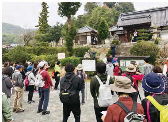
湯野歩け歩け大会（湯野地区）