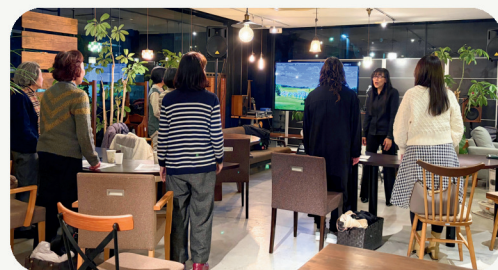
▲歌のレッスン講座の様子

読書会やソロカフェ、足もみ倶楽部を定期開催しているほか、参加者やスタッフそれぞれが興味のあることを企画しています。最近では、歌のレッスンや旅のシェア会などを開催しました。