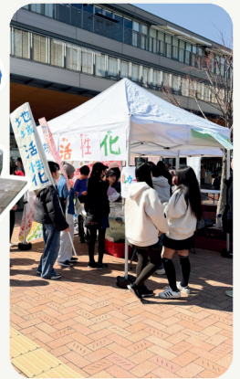
▲地域マーケット“冬”