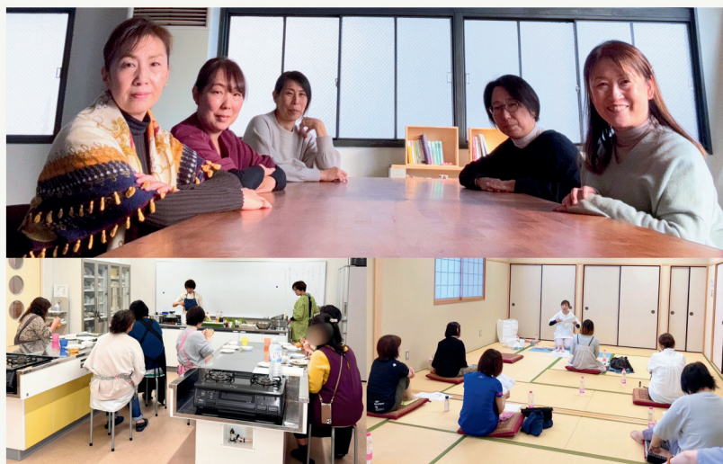
▲上：メンバーの皆さん 左下：料理教室 右下：足もみ倶楽部