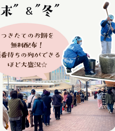
▲地域マーケット“歳末”